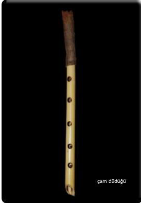
Resim 6: Çam Düdüğü