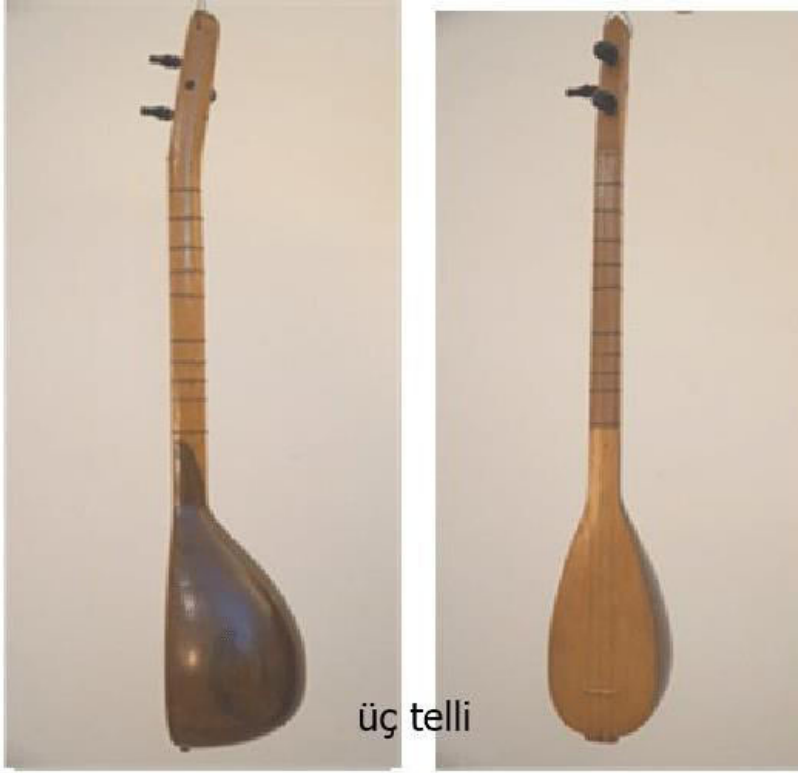
Resim 2: Üç Telli Saz

Masıt Kırıkları genellikle üç telli küçük sazlar ile çalınır. Kısa saplı çöğür bağlama ve uzun saplı bağlamalar ile de icra edilebilir. Üç telli saz esasen kopuz menşelidir. Mızrap kullanılmaz, 30 cm ile 80 cm arasında değişen boyutları mevcuttur. Bir el klavye ile notalara basarken diğer el parmakları aşağı yukarı hareketlerle ritim tutulmasına yardımcı olur. Bazen parmak çekmesi, bazen avuç çekmeleri yapılarak çalınır. Ustalaşmak çok uzun yılları alabilmektedir. Çalma şekillerinin arasında iki parmak ile yukarı aşağı seri hareketler ile vuruşlarda söz konusu olabilir. Bazı gaydalarda ise parmak şaklatma şeklinde de ara figürlere yer verilmektedir. Sözler genelde doğaçlama olarak yerleştirilmiştir. Hayri Dev'in TRT repertuarında yer almış en meşhur çalışması "Zülüfleri Taramış" adlı çalışmasıdır. Çalma tekniği, sözleri ve oyunu ile tamamen Karaman Kültürünü temsil eden olağan üstü çalışmadır.