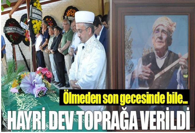
Resim 12-13: Basında vefat haberleri